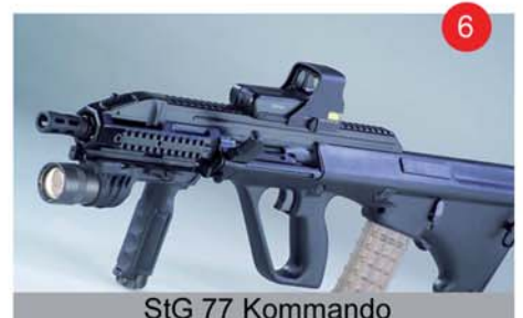
StG 77 Kommando