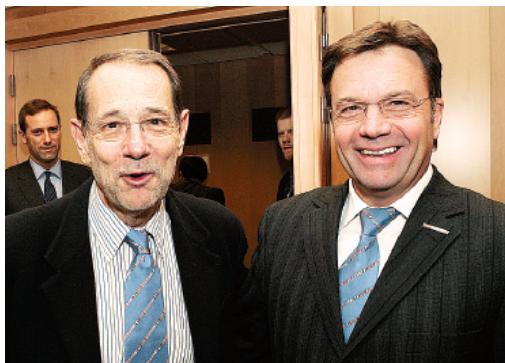
„Mr. GASP“, Javier Solana, mit dem österreichischen Verteidigungsminister Günther Platter am 24. Jänner 2006

Ein Arbeitsschwerpunkt der Agentur ist, abgeleitet von den strategischen Vorgaben, die Entwicklung einer Langzeitvision für die Europäische Sicherheits- und Verteidigungspolitik. Diese blickt 20 Jahre in die Zukunft und soll drei Bereiche umfassen. Erstens der globale Zusammenhang zwischen Wirtschaft, Gesellschaft, Demografie, Umwelt und Recht, zweitens die Natur zukünftiger Krisenmanagement-Operationen und drittens Trends in der Wissenschaft und der Technologie.