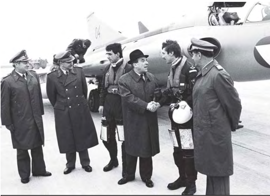
Bundesminister Lichal bei der Übernahme der Draken